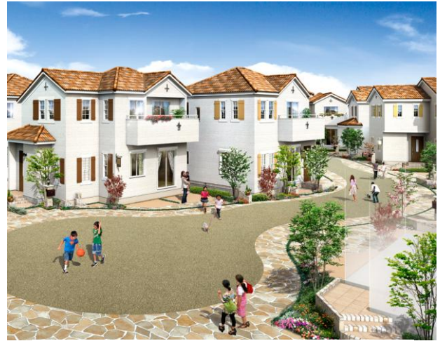
クラブアップル・コート街並みパース(2期販売予定)

また、豊かで統一感のある街並みを形成するため、垣や柵の構造の制限や、植栽の管理・保全のための取り決め、「まちなみ景観協定」を住民が結び、いつまでも美しい住環境を守ります。さらには、足立区が進める「ビューティフルウィンドウズ」運動(※3)にちなみ、窓周りには、7つの街区ごと異なる装飾(アイアングリル、よろい戸、フラワーBOXなど)を施しています。