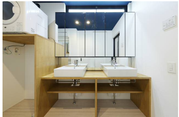
2 台の洗面化粧台、左上が乾燥機

DINKS 家庭では朝の時間が重なることもしばしば。2 人がスムーズに身支度ができるよう、洗面化粧台を 2 台横並びで設置しました。