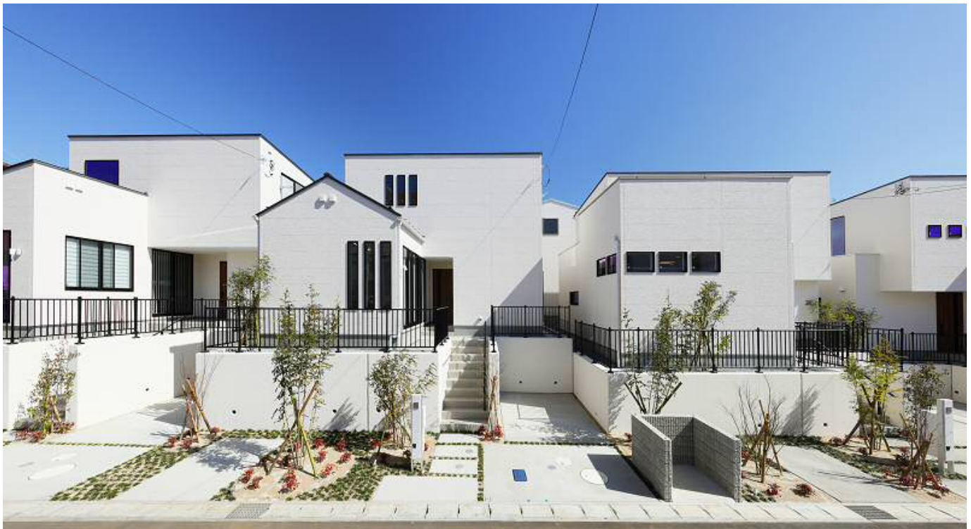
「Sumi-Ka すみ か そら 空の みのり 稔」街区街並み外観

その他、この DINKS 向け分譲住宅は、ゆったりとした室内空間の提案やダブル洗面化粧台、乾燥機など、2 人家族の生活のために必要なものの魅力を最大化した一方、ニーズの低いものを大胆に削除していった物件で、以下のような思い切った造りになっています。