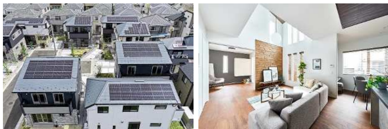
『アイムス花小金井 P.T.SITE』

『アイムス花小金井 P.T.SITE』ホームページ: https://www.polus.jp/kodate-ms-we/tanashi4/