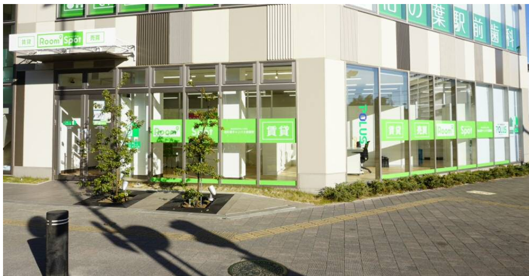
柏の葉キャンパス営業所写真

つくばエクスプレス沿線では、北千住営業所、南流山営業所に続いて3店舗目の営業所となり、同沿線での賃貸管理・仲介においてお客様へのきめ細かなサービス提供を目指してまいります。また、柏の葉キャンパス駅周辺は、国立大学のキャンパスや研究施設が集まっており、沿線の開発とともに人口増加中の地域となっております。お客様に良質な賃貸住宅の提供を行うとともにグループ中長期戦略における TX 沿線駅で柏エリアのグループシェア拡大に努めてまいります。