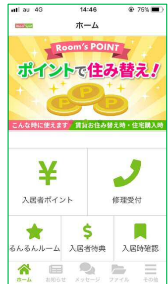
アプリトップ画面イメージ

今までのように電話での連絡と異なり、チャットでのメッセージ送受信ができます。ちょっとした相談事も、通勤・通学等の隙間時間に簡単に管理会社へ連絡することができます。