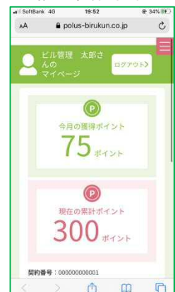
入居者ポイント画面