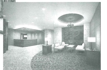
コンシェルジュが24時間常駐するラウンジ