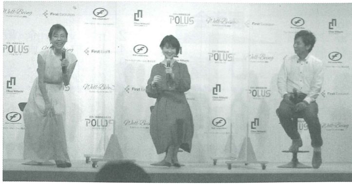
暮らしの本音トークで会場が盛り上がった

等も想定した子育て世代から高齢者まで幅広い層の入居者をイメージしている(間取りは1LDK~3LDK)。高水準のケアサービスのほか、フィットネススタジオや各種アクティビティなどの健康サポートや各種プログラムを用意している。プライムシェアとの提携やレストラン・コンビニ・大浴場などの共用施設