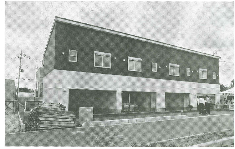
ガレージハウス賃貸