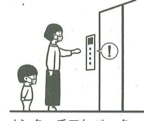
ノンタッチエレベーター