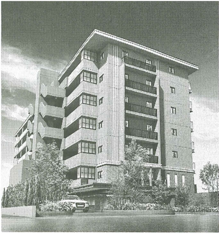
「ルピアカート津田沼」外観

ポラスグループがコロナ禍において「さわらない・もちこまない」ノンタッチにこだわったマンションを発売した。マンションにおいてここまでノンタッチにこだわったものは今までは発売されて