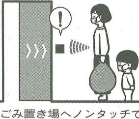
ゴミ置き場へノンタッチで

エントランスでは、ハンズフリーの非接触キーシステムを採用している。次に②共用部にノンタッチの手洗いを設置している。おとなサイズ、子どもサイズの2台用意。手洗い後に除菌水も流すことができる。