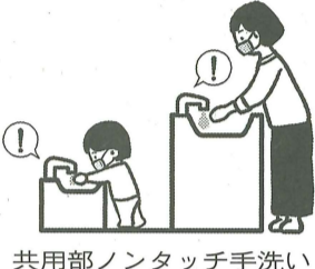
共用部ノンタッチ手洗い