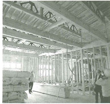
建設中の富士工場事務所

長は、プレカット事業での非住宅分野の受注拡大に取り組んでいる。非住宅推進部（下山順部長）を設け、15人の部員を本社と各地の支店に専門の部員を配置し、全国体制で非住宅受注への支援がで 北、坂東（茨城）、富土、滋賀、佐賀の5カ所に拠点となる工場を、月間加工能力は17万5000坪に達する。これまででは東北、や特殊加工は提携工場へ依頼して対応してきたが、社内での対応力を向上させている。