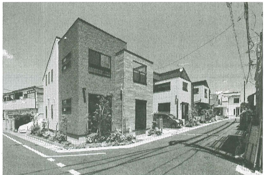
分譲住宅地「東京5LDK@練馬光が丘」の街なみ

1階居室の壁をガラスの可変仕切り出し、シーンによってワークできるようにしている。