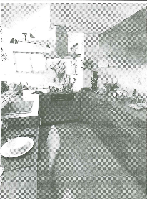
ダイニング一体型キッチンのモデル。家事代行を利用したいが、プライバシーは守りたい意向を反映した

JR東北本線東大宮駅から徒歩28分に位置する107〜1135平方メートルの区画に建物面積92〜103平方メートルLDK4LDKを建設。販売価格は3180万〜4280万円（税込み）。