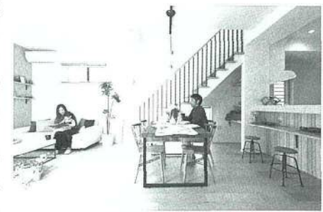
インテリアデザインは、あたたかみを感じるナチュラルな雰囲気に

2期販売分の建物の外観は、木目と石目調のサイディング、シックな色合いとスタイリッシュな造りがシャープな印象を与える和モダンスタイルとなっている。