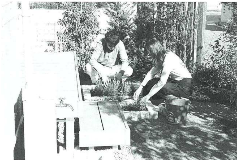
緑溢れる住宅が特徴の「リーズン船橋・馬込沢 プレシヤスガーデン」。野菜やハーブを育てることができると「ポタジェ」を庭に設置

第一期販売を11月11日からスタートさせているが、来年1月に二期、5月に三期の販売を行っていく予定。 販売価格については、敷地面積135平方メートル以上、なおかつ全棟2台のカースペースを確保しているにも関わらず、4000万円を超えない価格帯で販売していくという。