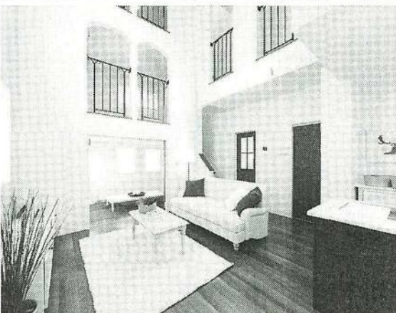
(上) 南ひな壇の陽射しを愉しむ家の室内 (下) スペインのバルをイメージした家の室内

所在地 埼玉県朝霞市 根岸台3丁目99番1 他、交通 東武東上線 「朝霞」駅より徒歩19分 もしくはバス8分・バス 停より徒歩7分、総戸数 64棟、敷地面積 110 0.00㎡〜173.94㎡、 建物面積 89.73㎡〜1 13.43㎡、間取り 2 LDK+土間収納+ウォ ークインクローゼット、 販売価格 33380万円 (税込)、4780万円(税込)、 入居予定 2017年9 月上旬。