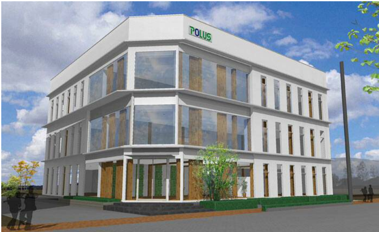
住宅品質保証(株)本社パース

ポラスグループではこれまで、自社施設の「ポラス建築技術訓練校」、「ウッドガーデン」の木造オフィスを建築している他、福祉施設、スポーツ施設、幼稚園、病院、教会、倉庫などの非住宅木造建築事業に取り組んでおります。「住宅品質保証(株)本社屋」の建築を機に木造建築物の普及と事業拡大を目指してまいります。