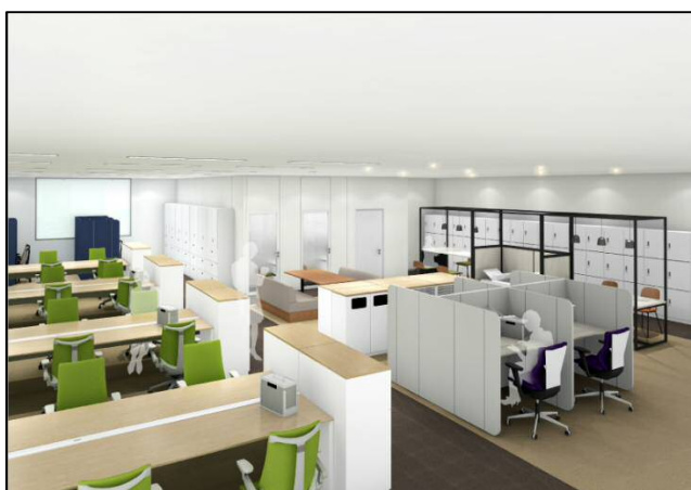
1階オフィススペース