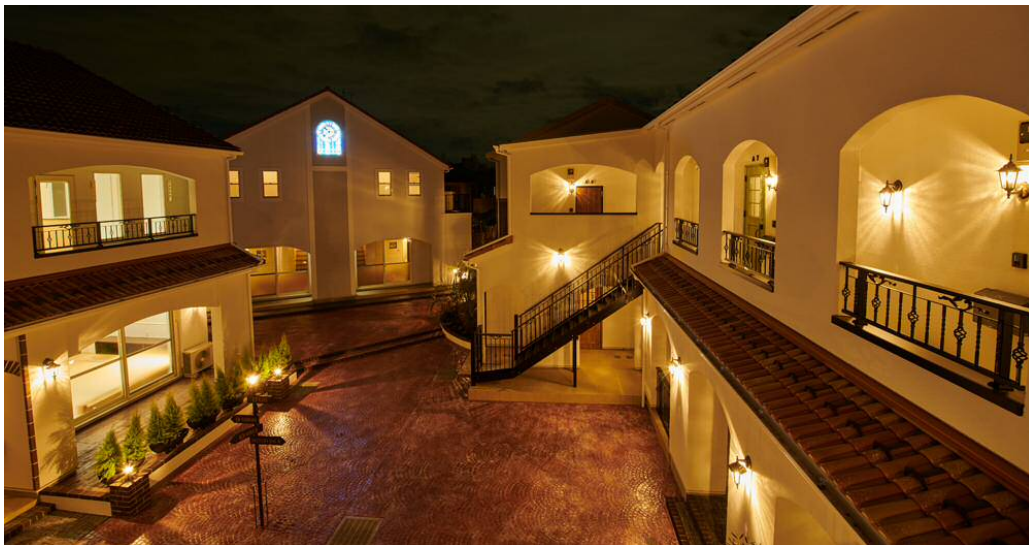
中庭から臨む「CHOCOLAT」夜景

今回の賃貸物件は、施主様のご意向により非常にユニークなコンセプト、デザインを採用、供給過剰気味で空き部屋リスクが高まっている賃貸市場に新たな風を呼び込むものとなっています。