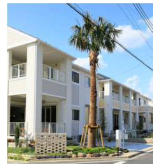
景観木のサバルヤシ