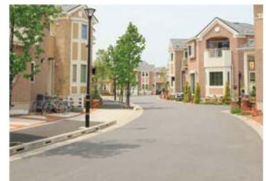
街区内曲線道路(イメージ)

街区区内に入る3か所に防犯カメラ設置。住民の目と併せて暮らしの安全・安心を守ります。