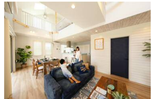
コースタル・ステイト モデルハウス 15-63 号棟

世界有数のリゾート地として知られるアメリカ西海岸のカリフォルニア。ブラックの屋根にコントラストを描くホワイトの壁材、アクセントとしてラップサイディングが青い空に映え、邸宅感を醸し出した外観デザインとなっています。