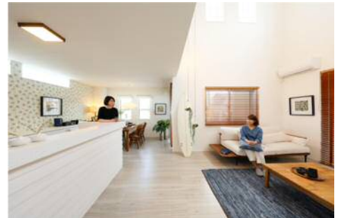
コースタル・ステイト モデルハウス 15-67 号棟

木の味わいを持つインテリアを厳選し、落ち着いた室内空間となるように木目調のフロア材を採用。キッチンカウンターはウッドパネルやタイルカウンターでお洒落にデザイン。カラフルな色合いが美しいリゾート感を演出します。(ウッドパネルはポラス暮らし科学研究所が開発)