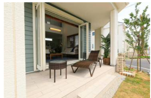
コースタル・ステイト モデルハウス 15-67 号棟

贅沢な憩いを演出するリゾートプランとして、室内の寛ぎと外の開放感を同時に楽しめるフロントポーチ、リビングと庭との間にもう一つの憩いの空間としてアウトドアリビングを採用し、各戸が外と内とつながる開放感や人と人との絆を感じられるプランとしました。ゆったりとした住空間のために収納(土間収納・パントリー・ウォークインクローゼット)をポイントにした間取りを構成し、吹き抜けやモダン和室も多く採用しています。