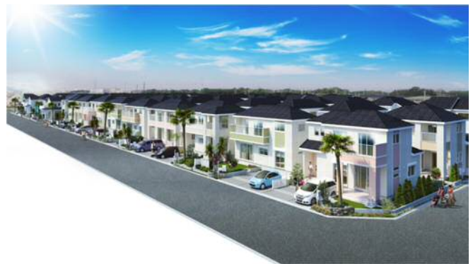
パレットコート柏たなか エヴァーシティ全体景観 パース

アメリカのリゾート地として知られる「フロリダ」「カリフォルニア」「ハワイ」「リッチモンド」「サンタバーバラ」「ブルックリン」の6つの異なる美しい都市をモチーフにしなが、リゾート感あふれる佇まいを形成しています。それぞれのテーマを演出するとともに街の外周に植樹されたサバルヤシ(景観木)や各戸のシンボルツリーと6つの街が融合した美しい景観を創り上げていきます。