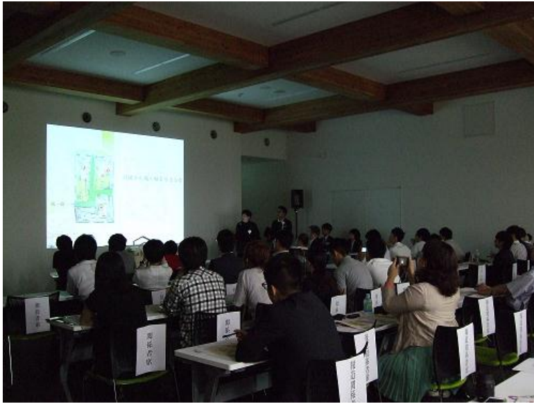
公開審査会 プレゼンの様子