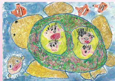
<第1回おえかきコンクール受賞作品>