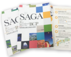
佐賀県企業立地ガイドはHPからダウンロードできる

「知事や市長が直々にこられたのには驚きました。地方に進出する場合は、地元の方と仲良くできるかが大事。佐賀県なら間違いなくと思いました。あんなに厚いパンフレットも初めて見たし、手作り感のあるイメージパースも良かったね(笑)。」 「佐賀県企業立地ガイド」と題されたパンフレットには、災害の少なさや豊富な人材といった佐賀県