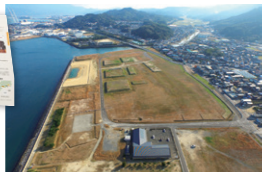
海を臨む場所にプレカット工場が建設される